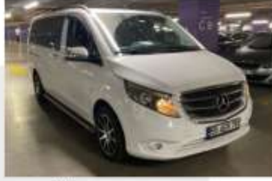
2. Sağ Ön Çapraz