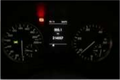
11. Araç içi kadran