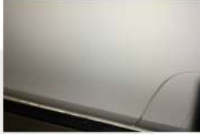
SOL ÖN KAPI