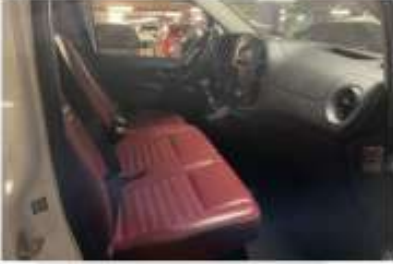
7. Araç içi sağ ön sıra