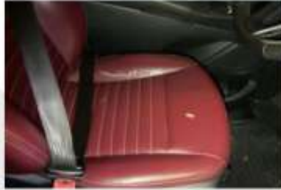
KOLTUK DÖŞEMELERİ VE AYAR DÜĞMELERİ