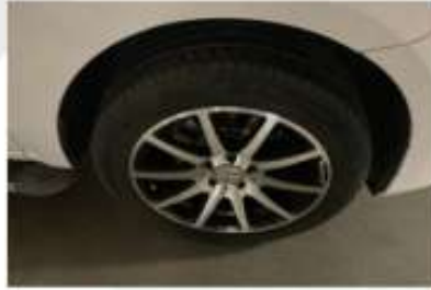
Sağ Ön Lastik