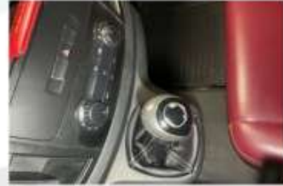
VİTES TOPUZU VE KÖRÜĞÜ