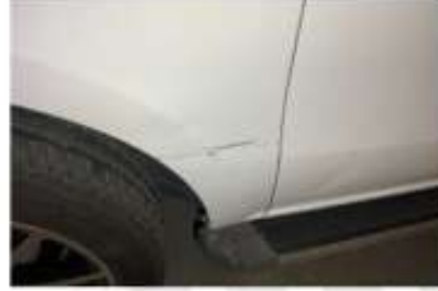
SAĞ ARKA ÇAMURLUK