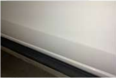
SAĞ ÖN KAPI