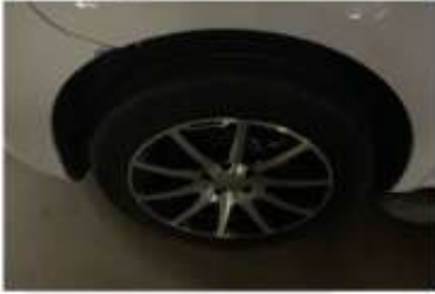
Sol Ön Lastik