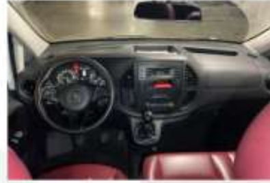
6. Araç için ön Konsol