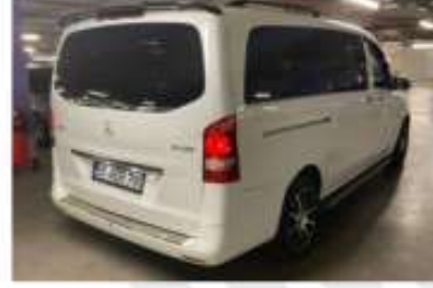
3. Sağ Arka Çapraz