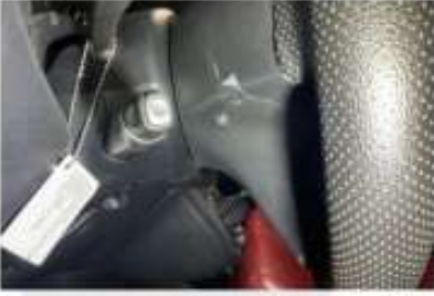
DİREKSİYON AIRBAG KAPLAMASI