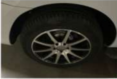
Sağ Arka Lastik