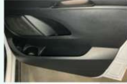
KAPI İÇ KOLLAR VE DÖŞEMELERİ