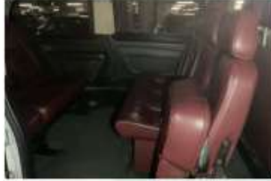
8. Araç içi sağ arka sıra