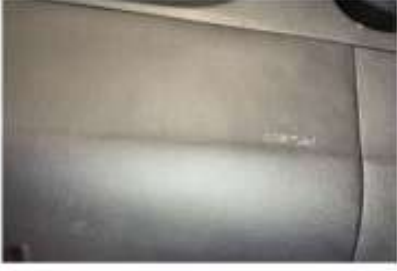
TORPİDO AIRBAG DÖŞEMESİ