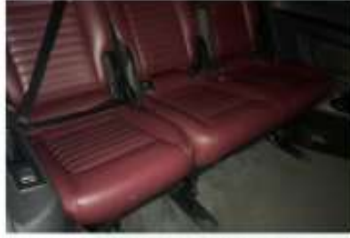
KOLTUK DÖŞEMELERİ VE AYAR DÜĞMELERİ