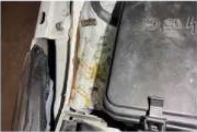
SAĞ İÇ PODYA