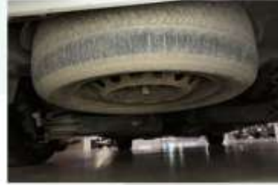
STEPNE VEYA TAMİR KİTİ