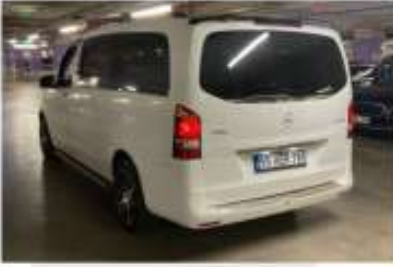
4. Sol Arka Çapraz