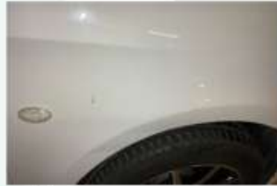
SAĞ ÖN ÇAMURLUK