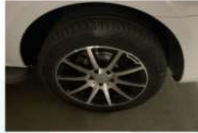
Sol Arka Lastik