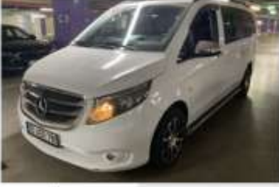
1. Sol Ön Çapraz