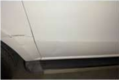
SAĞ ARKA KAPI